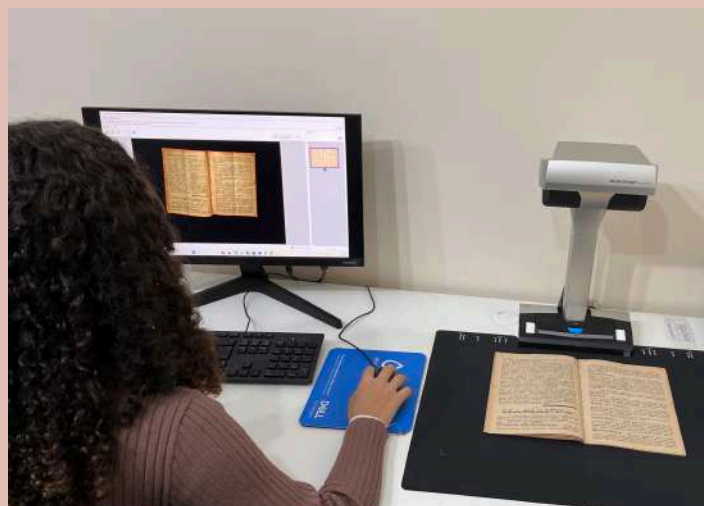
As revistas já começaram a ser digitalizadas pelas arquivistas, em ordem cronológica decrescente

A boa notícia é que, em breve, estaremos realizando a digitalização de todas as edições anteriores à 2018, bem como a indexação do conteúdo de cada informativo. Essa etapa é importante para conservar e facilitar o acesso à