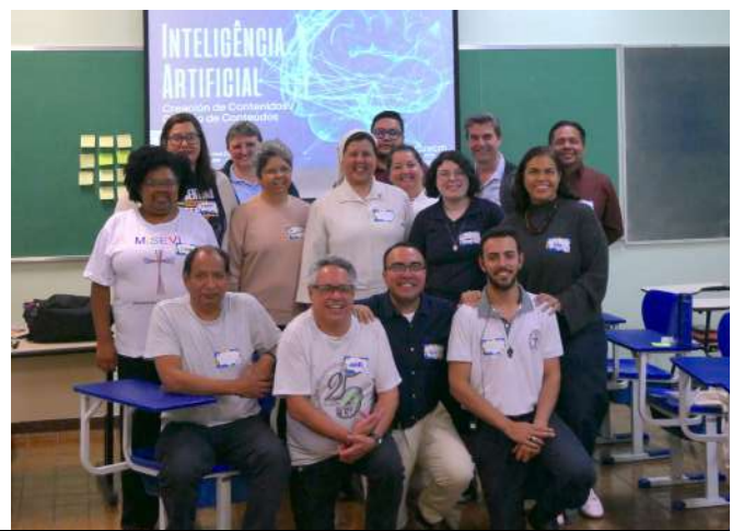
As quatro oficinas simultâneas do 3º Simpósio de Comunicadores Vicentinos: produção de vídeos, assessoria de imprensa, laboratório de podcast e utilização de IA na produção de conteúdos vicentinos.

trouxe um importante ponto: todos vemos a realidade de uma perspectiva distinta: “eu vejo de um jeito, e você, como vê?” Falar, ouvir, escrever, captar imagens e compartilhar esses materiais deve ser uma experiência de colaboração e ação com os pobres. E que antes de postar algo deve-se pensar a quem interessa a mensagem. Pode-se dizer onde estamos e o que fazemos, desde que isso seja acompanhado de um serviço.