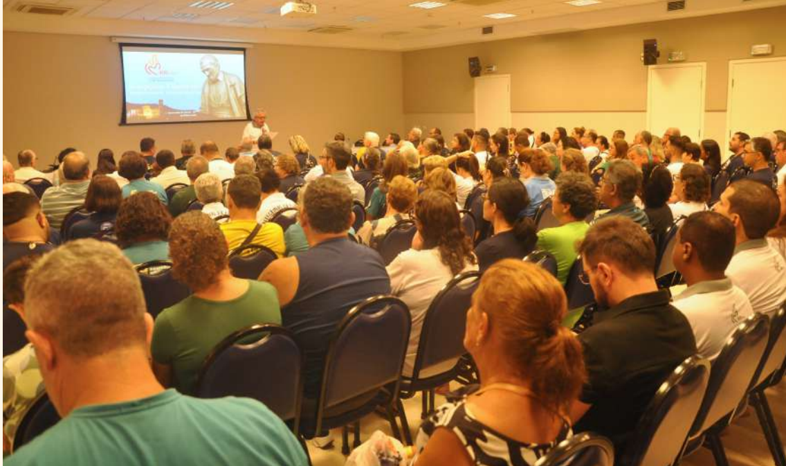
Participantes da Romaria dos Vicentinos à Aparecida, realizada entre os dias 27 e 29 de março de 2025

missão vicentina na Igreja e com a Igreja. São Vicente, homem com profundo senso eclesial, nos inspira a trabalhar na formação dentro do espírito eclesial, comunitário e colaborativo. É preciso formar missionários que se cuidem para não cair no individualismo, no consumismo e no narcisismo, e saibam trabalhar em comunidade e de modo planejado, compartilhando dons e esforços, na missão assumida em comum; missionários que se cuidem para não cair nos modismos pastorais (movimentos, práticas e espiritualidades que alienam, que fecham as pessoas em mundos religiosos restritos, que levam mais à autorreferência e não ao serviço efetivo, generoso e gratuito).